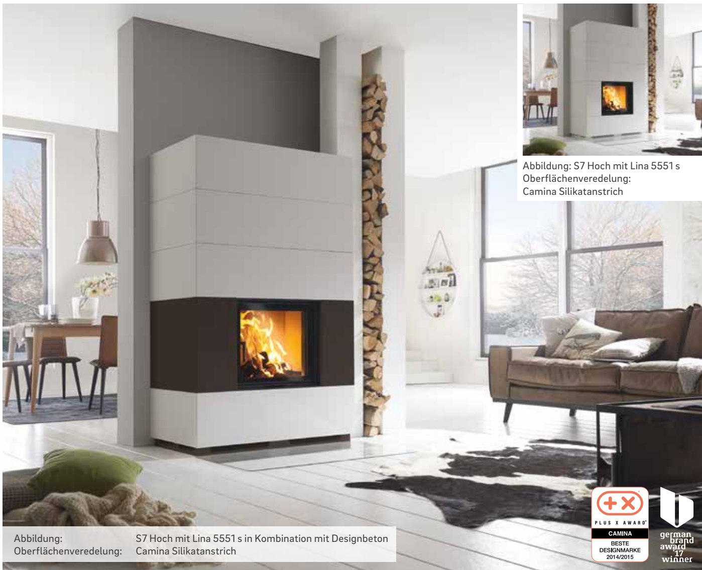
Abbildung: S7 Hoch mit Lina 5551 s Oberflächenveredelung: Camina Silikatanstrich