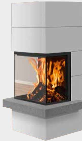
Club Tre Sims Naturstein Ruvina