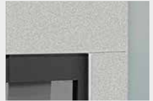
Bausatz-Elemente aus Leichtbeton (Anstrich erforderlich!)